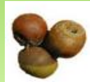
Épluchures de fruits et légumes / Fruits, légumes abîmés